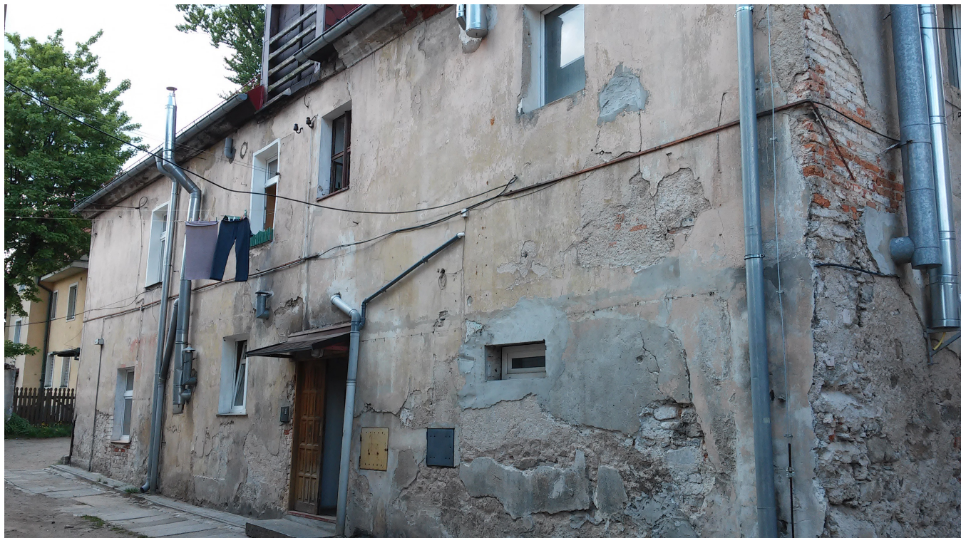
1 Maja 73 – elewacja od strony podwórka