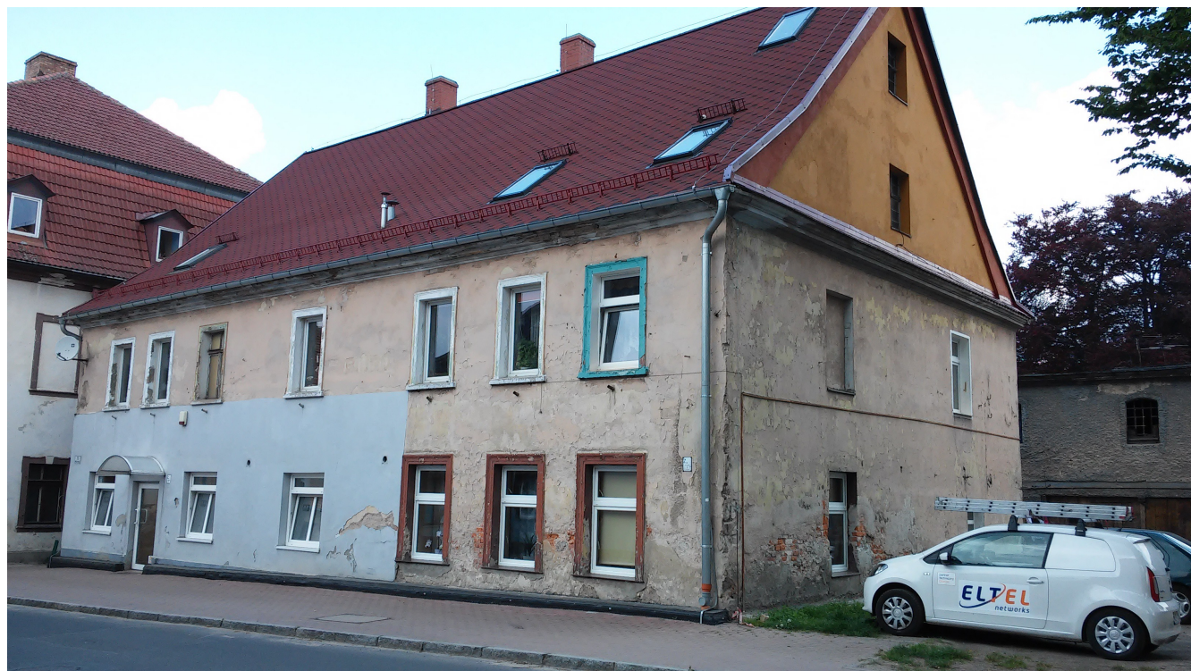
1 Maja 73 – elewacja frontowa

Instalacje: elektryczna, gazowa, wodociągowo-kanalizacyjna. Ogrzewanie indywidualne.